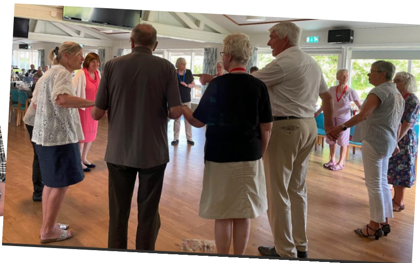
Billeder fra tovholderfesten lørdag den 25. maj